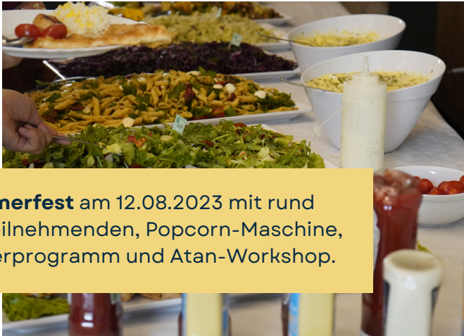
Sommerfest am 12.08.2023 mit rund 90 Teilnehmenden, Popcorn-Maschine, Kinderprogramm und Atan-Workshop.

Zur Vernetzung und Sichtbarkeit der Diaspora und Vorstellung des Projekts HamWatan haben wir drei Events geplant und durchgeführt - in enger Zusammenarbeit mit vielen Ehrenamtlichen.