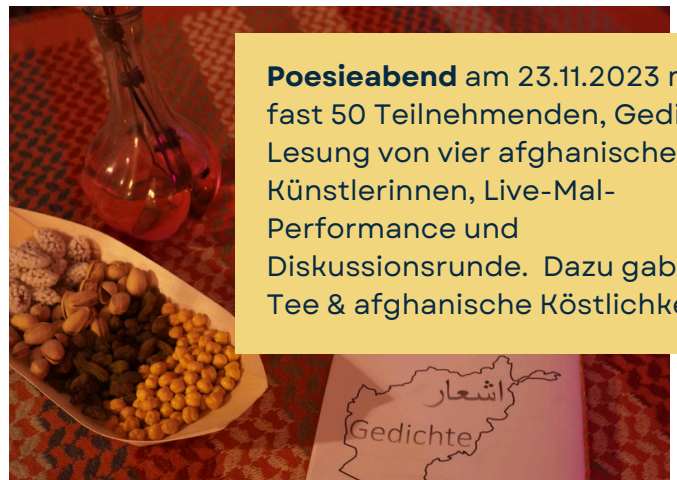
Poesieabend am 23.11.2023 mit fast 50 Teilnehmenden, Gedicht-Lesung von vier afghanischen Künstlerinnen, Live-Mal-Performance und Diskussionsrunde. Dazu gab es Tee & afghanische Köstlichkeiten.